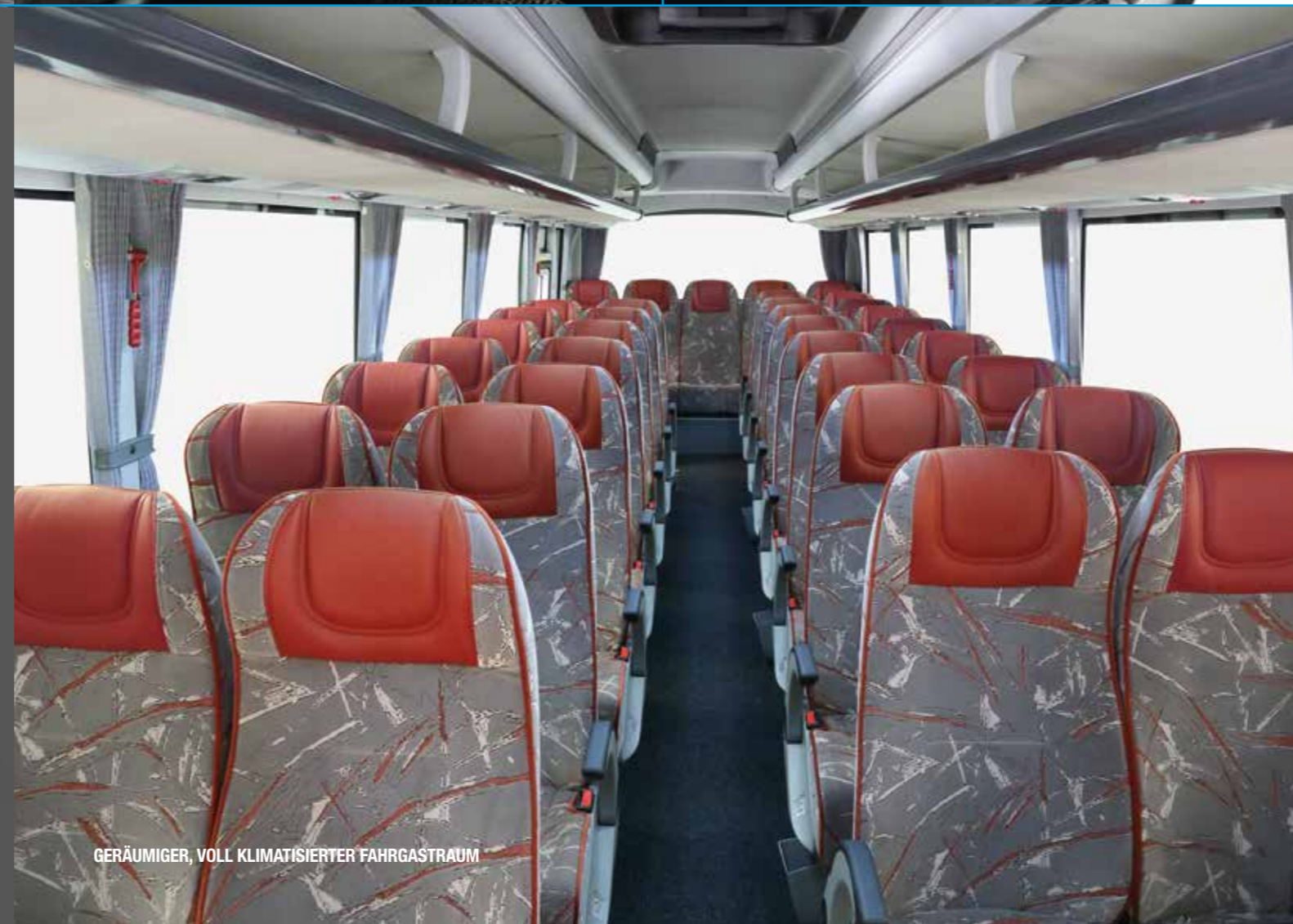
GERÄUMIGER, VOLL KLIMATISIERTER FAHRGASTRAUM