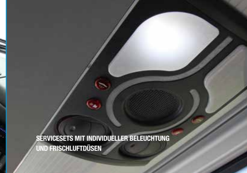
SERVICESETS MIT INDIVIDUELLER BELEUCHTUNG UND FRISCHLUFTDÜSEN